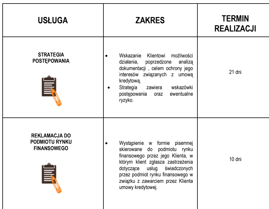
Wykaz dostępnych Usług